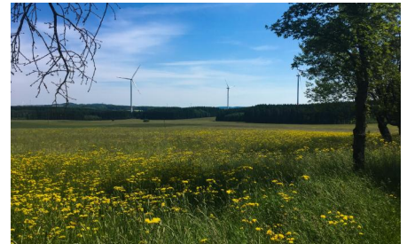
Blick zur Fuchskaute