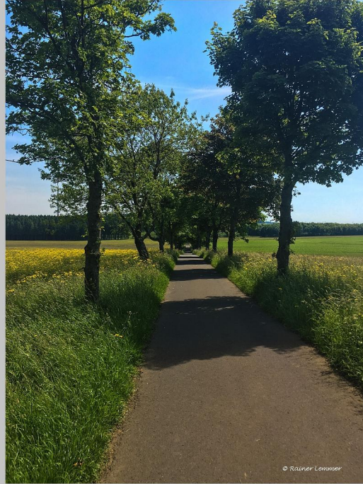
Radweg Höhn zur Fuchskaute